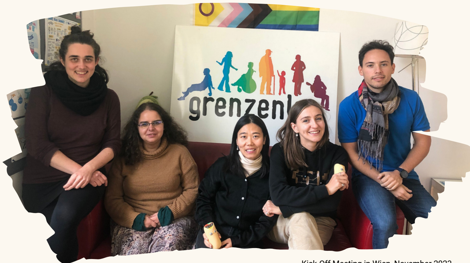
Kick-Off Meeting in Wien, November 2023